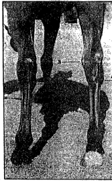
A: esparaván. B: corva. C: corvaza.